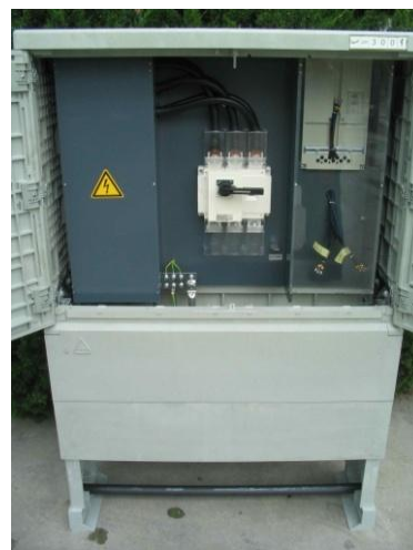
JZK300, 630A főkapcsolóval