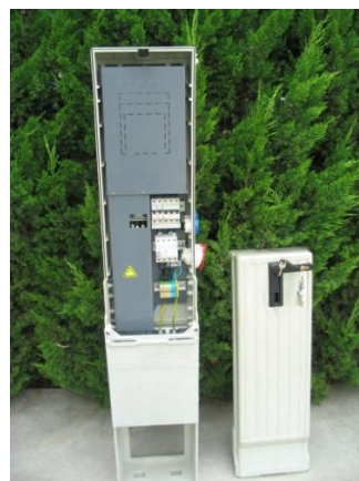
(pl. JZD 305, 80A, NH00 aljzattal)