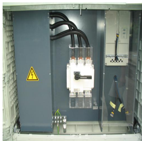
JZK300, 630A főkapcsolóval