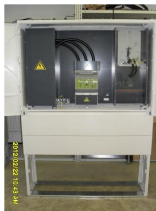
Sypniewski (Sn) 300-400A