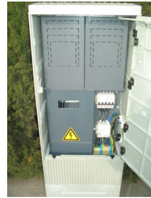
(pl. JZD 335, 80A, NH00 aljzattal)