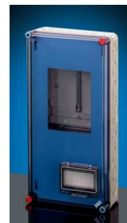
Mi 72471S (300x600 mm)